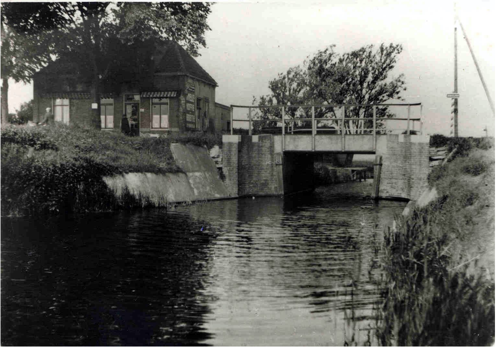
De Voort, rond 1925:weinig doet dit idyllische plaatje vermoeden.