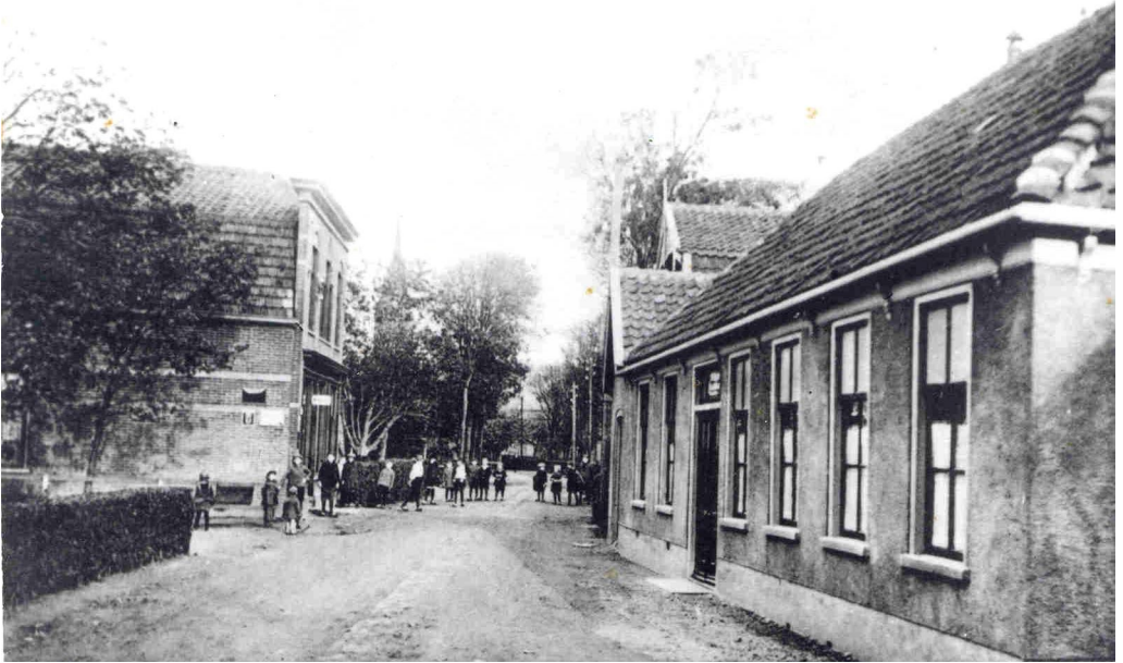
De Dusseldorperweg vóór de verandering. Vaag is het paardepad te zien. De rest was zand.

Voor de lengte van 2024 meter die dat besloeg, ging dat f 24.500,- kosten. B & W vonden dat veel te duur, maar als het niet doorging kregen ze ook weer boze gezichten. Uiteindelijk werd er een stuk van 800 meter van teerslakken voorzien en 3000 meter paardepad werd opgebroken en ingewalst.